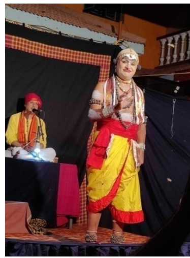
ಪುಷ್ಪಕ ಯಾನ ಮೋನೋ ಆಕ್ಟ್ ನ ದೃಶ್ಯ